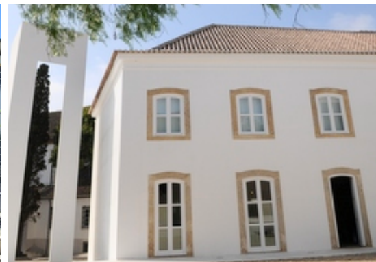
Centro Cultural do Palácio do Egípto (Cerimónia de Entrega do Prémio Artes & Ofícios | Novo Design)