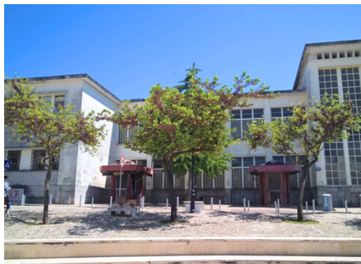
Mercado Municipal de Oeiras (Mostra / Workshops / Educação Patrimonial)