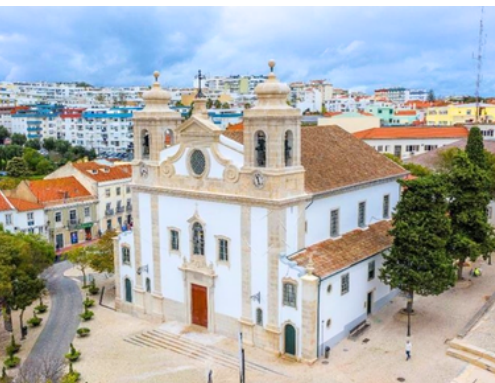
Espaço público centro de Oeiras – Largo 5 de Outubro (Informações / Programação Cultural)